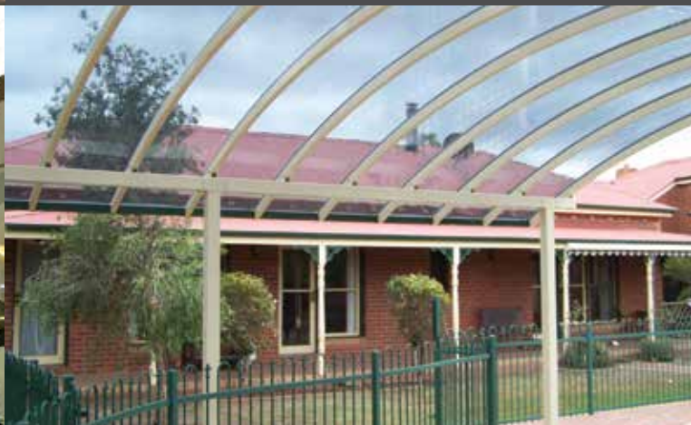
Residencial, Danpal® Compacto, Sydney Australia