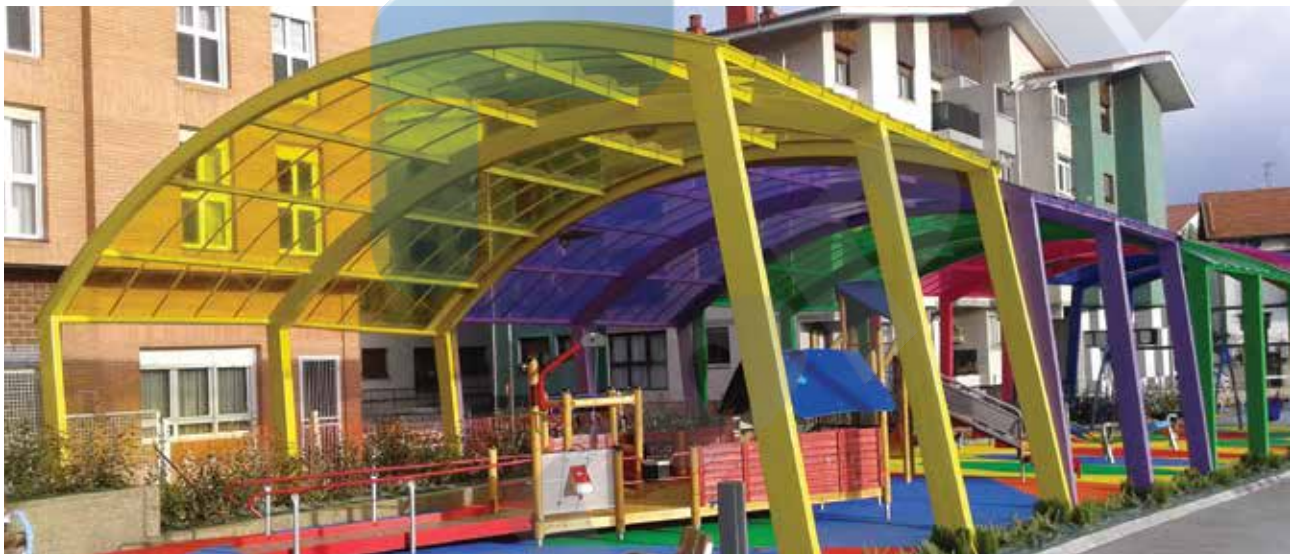
Parque de juegos, España | Danpal® Compacto | Arquitecto: Kepa Sacristan