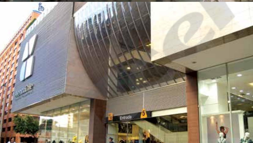
Centro Comercial Av Chile, Colombia | Danpal® Compacto