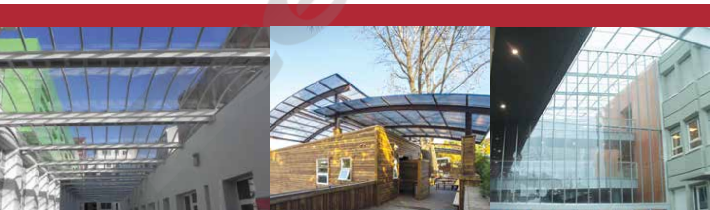
Colegio Zankoeta, España Danpal® Compacto Arquitecto: Mentxaka